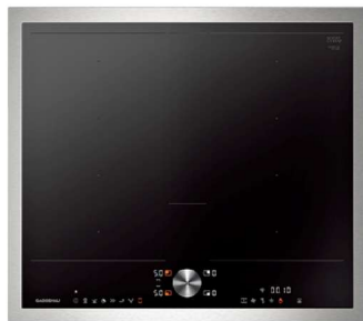
IHクッキングヒーター