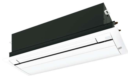
天井カセットエアコン参考写真