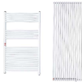
パネルヒーター参考写真