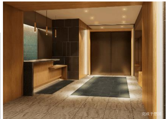
コンシェルジュデスク

※サービス内容は変更もしくは中止になる場合がございます。また、サービスは時間や内容によっては、お受けできかねる場合がございます。一部有料となるサービスがございます。