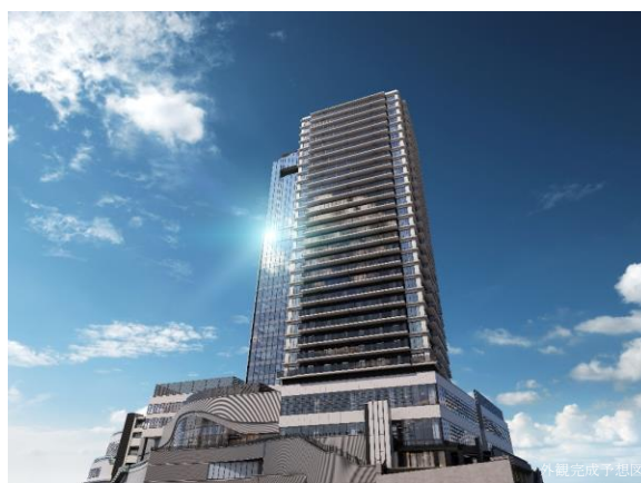
THE TOWER HIRAKARA 建物外観