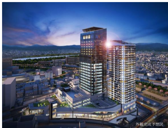
再開発事業全景 (左:ホテル・オフィス棟 右:THE TOWER HIRAKATA)